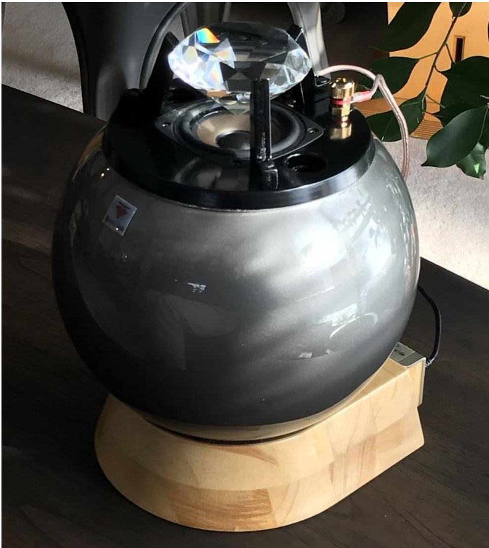
BA082にBG031-GM(ガンメタ塗装バージョン)をセットした例。

このたびは、トムズラボ製品をお買い求めいただきまして、誠にありがとうございます。