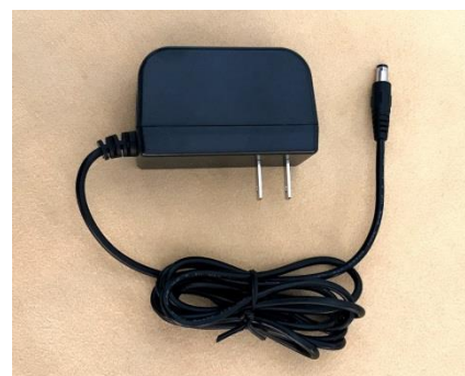
キッコサウンド OKARA oh.1