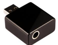
キッコサウンド OKARA oh.1 プレミアムモデル