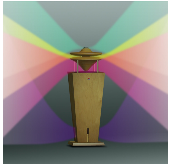
同シリーズRP123-NA 音の放射状態

これによりIOSSの再生音は、自然楽器の演奏状態に近づき、よりリアルな広がり感を創り出しています。