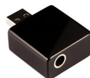
キッコサウンド OKARA oh.1 プレミアムモデル

Tom's lab 〒434-0034 浜松市浜北区高畑2-3 TEL : 053-589-3927 E-MAIL : info@tomslab.jp HP : http://www.tomslab.jp/